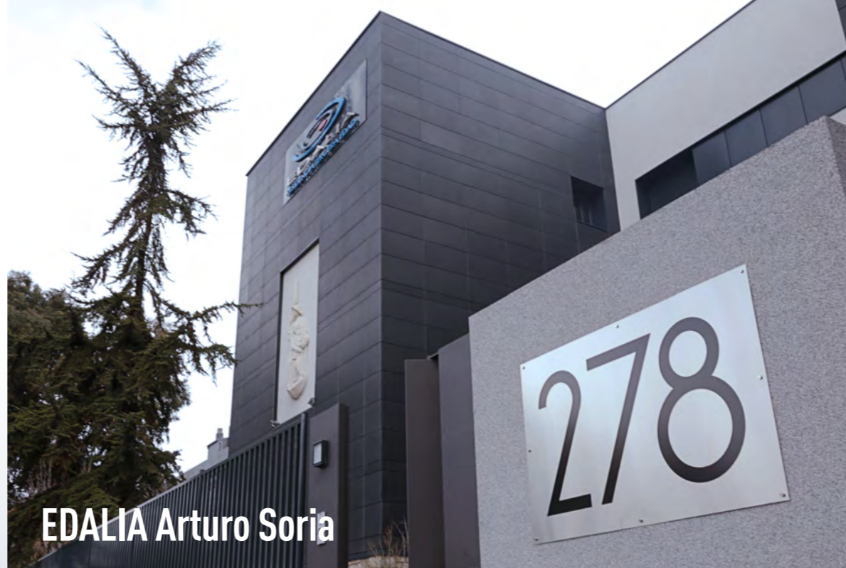
EDALIA Arturo Soria

Arturo Soria, 278. 28033 Madrid Tel.: 917 66 20 69. e-mail: arturosoria@edalia.es www.edalia.es